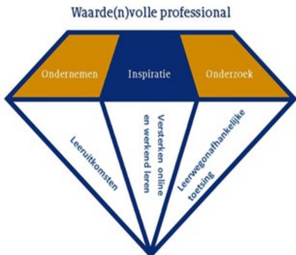
Figuur 1: Facetten Windesheim-onderwijsconcept

Voor de onderwijsomgeving van flexibel onderwijs voor volwassenen heeft Windesheim zes facetten geformuleerd: