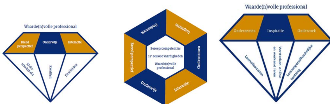
Figuur 1: Facetten Windesheim Onderwijs Concept

Ook bij het deeltijdonderwijs wordt er verbinding tot stand gebracht tussen onderwijs, onderzoek en ondernemen (de drie O's). Door onderwijs, ondernemen en onderzoek te combineren zorgt een opleiding voor de inbreng van het werkveld in het curriculum. Studenten leren in het onderwijs een onderzoekende houding te ontwikkelen. Het bijbrengen of versterken van onderzoeksvaardigheden vormt een onderdeel van dit proces. Ook draagt dit bij aan de innovaties in het werkveld en de regio.